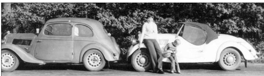
V sedmdesátých letech jsme populary používali také jako běžná vozidla. „Modrý“ a „Bílý“ při prázdninové cestě na Domažlicko

Samozřejmě, takový fiat se sehnat nedal a také mi pro začátek připadal složitý. Vždyť zatím jsem s bratrem úspěšně zvládl pouze opravu mopedu Stadion a lodního motoru Tümmeler, i když základy od černého řemesla jsem měl. V legendární vývěskové službě pasáže Lucerna mě však tehdy zaujal inzerát na roadster Škoda Popular z roku 1935, přihlášený a údajně po malé opravě motoru pojízdný. Netuše do čeho jdu, jel