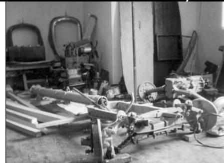
Zima 1970, podvozek těsně před dokončením v bratrově obýváku