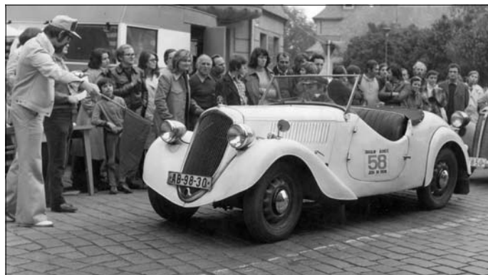
Na startu Zbraslavi 1974