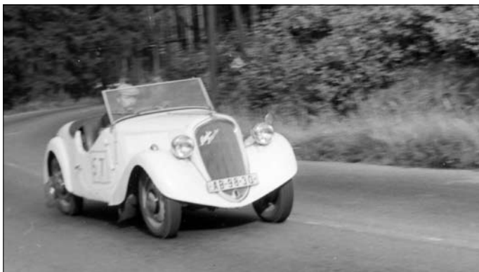
Zbraslav 1973, v ostrém tempu nad Baněmi