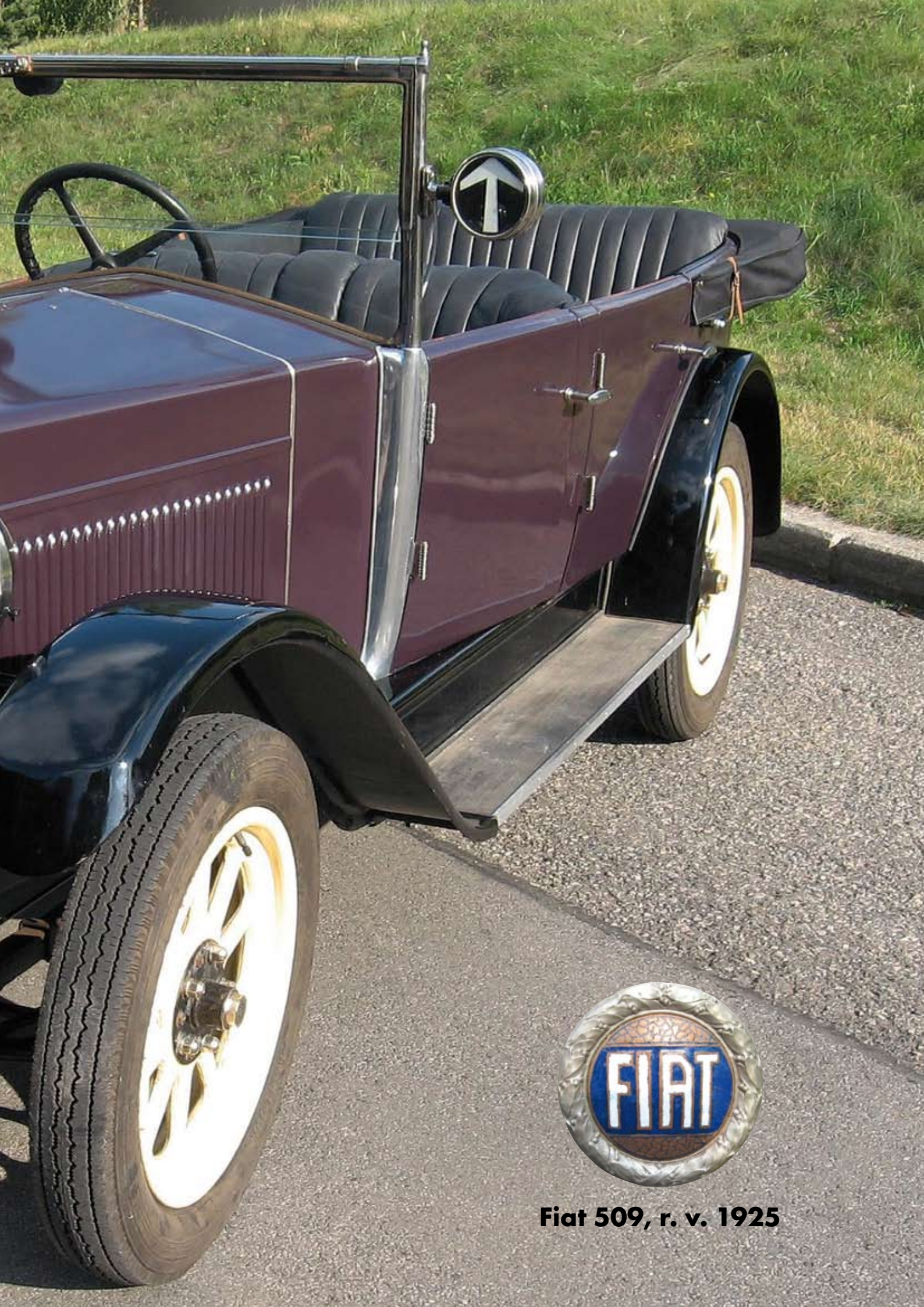
Fiat 509, r. v. 1925