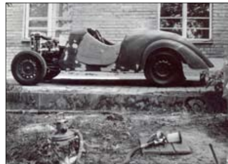
„Vysavačová“ stříkáci pistole Drukofix je při správném použití plnohodnotný nástroj. Osvědčila se později při mnoha dalších renovacích

Přitáhli jsme dalšího populara. Původně jsem ho koupil na náhradní díly, ale bratřovi se tak líbil, že nakonec skončil u něj